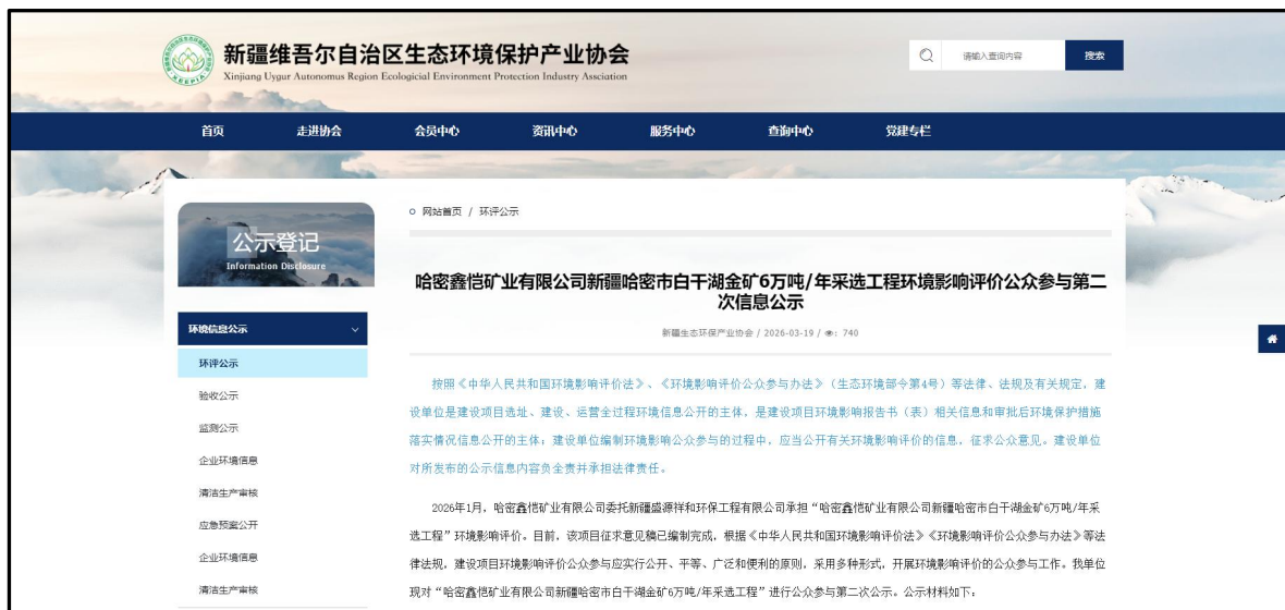
图 2 征求意见稿网络公示截图